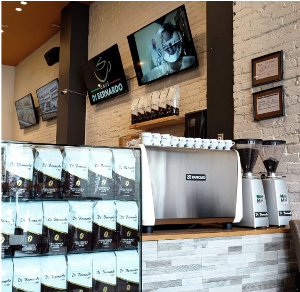
Le macchine da caffè Rancilio partner di Di Bernardo Caffè (immagine concessa)