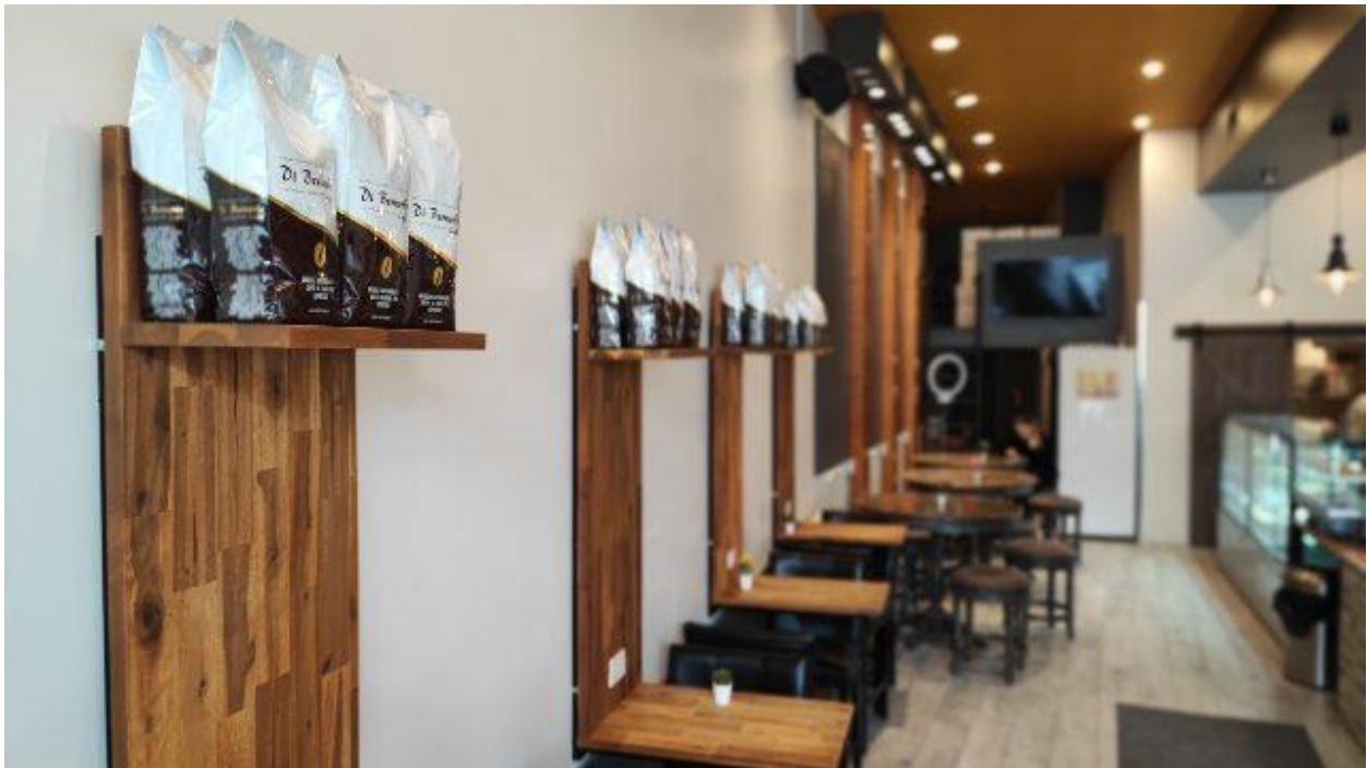
The interior of one of the Di Bernardo Caffè locations (licensed image)