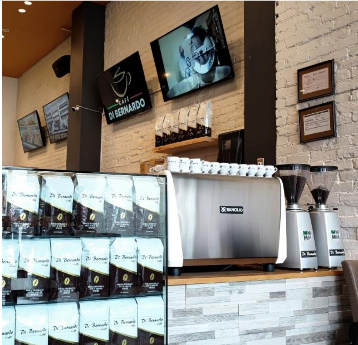
Rancilio coffee machines, a partner of Di Bernardo Caffè (licensed image)

To carry out this plan, Di Bernardo has chosen to enlist the company's long-standing partners, such as Rancilio for its coffee machines and Mazzer for its grinders.