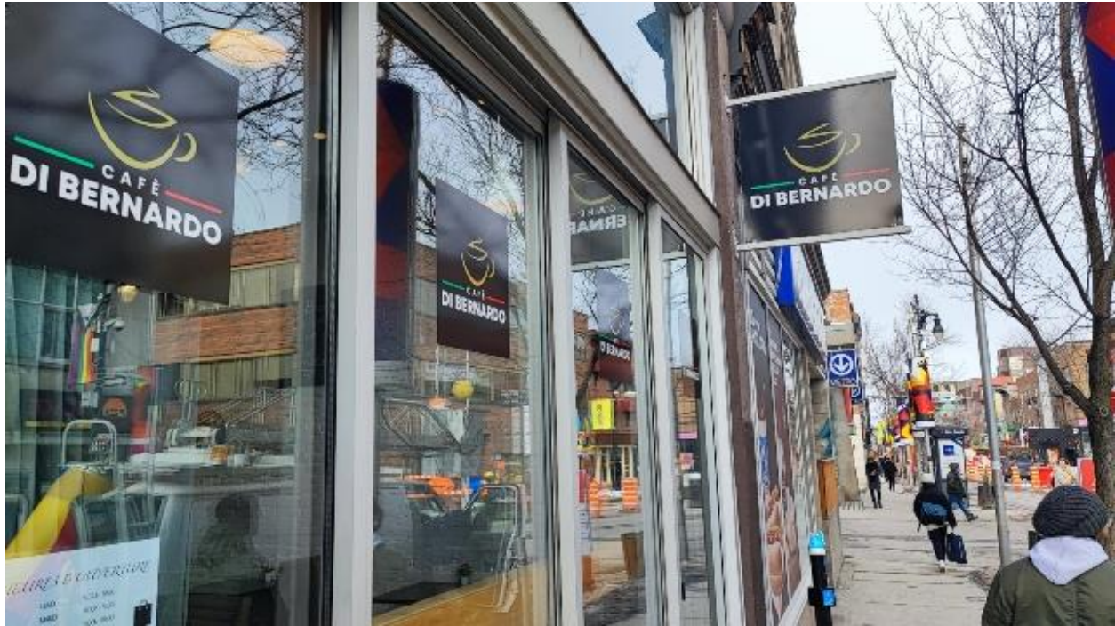
The exterior of one of the Di Bernardo Caffè shops (licensed image)

Thanks to his vast experience in the coffee sector, Di Bernardo has successfully created a truly unique product that combines traditional classic processing methods and more modern technologies.